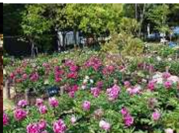
久宝寺緑地のシャクヤク園