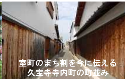
室町のまち割を今に伝える 久宝寺寺内町の町並み