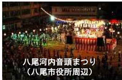
八尾河内音頭まつり (八尾市役所周辺)